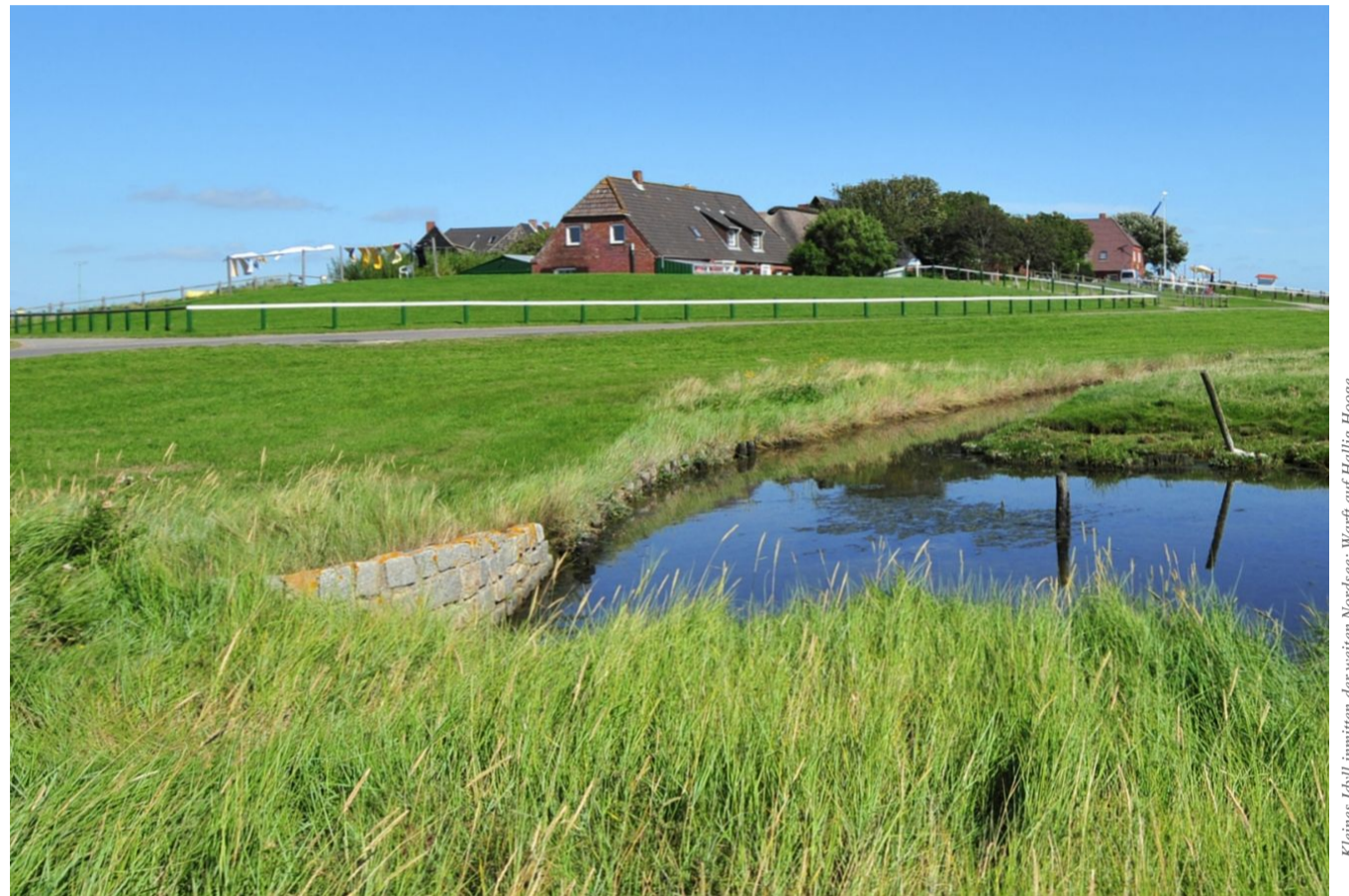
Kleines Idyll inmitten der weiten Nordsee. Warft auf Hallig Hooge

Zehn kleine Inseln trotzen den Sturmfluten und sind beliebte Ausflugsziele