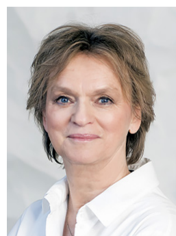
William Trevor, „Die Geschichte der Lucy Gault“

Dieser bewegende, spannende Roman ist der beste Schmöcker für graue Regentage: Er erzählt die Geschichte einer irischen Familie, die wegen der Religionskämpfe wegzieht, und dabei geht die kleine Tochter Lucy verloren und wird für tot gehalten. Nach Jahrzehnten trifft der alte Vater die totgeglaubte Tochter wieder, und dieser Stoff hätte bei einem schlechten Autor leicht ein Kitschroman werden können, aber der fast achtzigjährige irische Schriftsteller William Trevor erzählt diese Geschichte von Missverständnissen und schrecklichen Zufällen, verpassten Gelegenheiten und falschen Entscheidungen leise, warm, eindringlich und voller Mitleid.